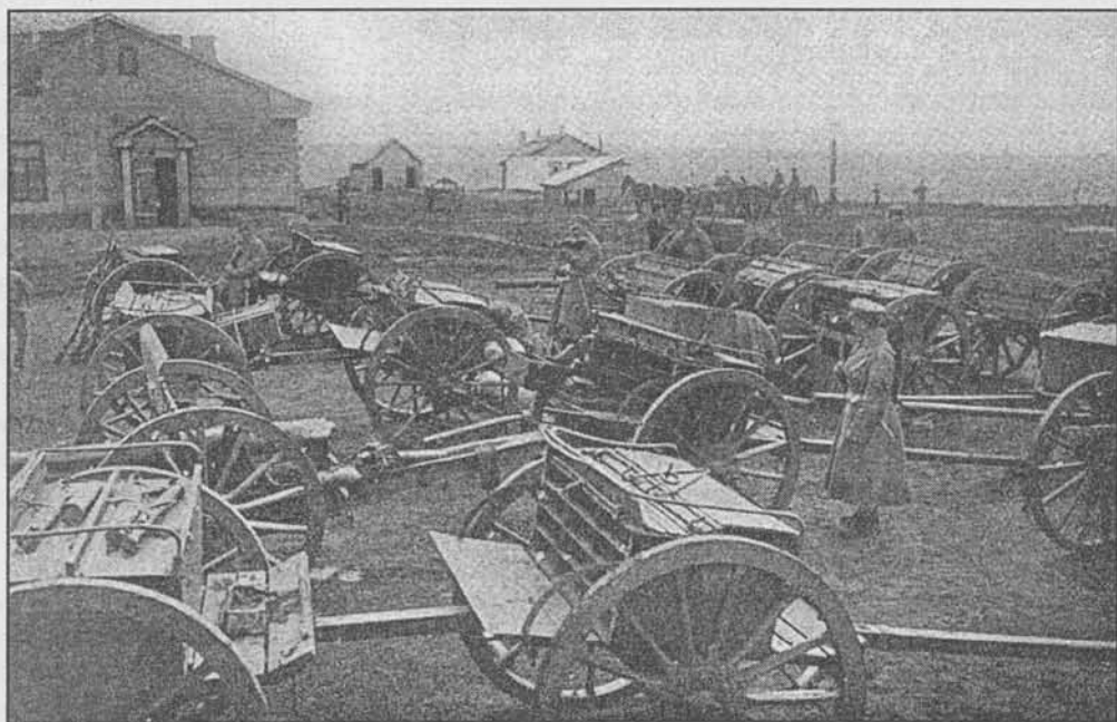
Артиллерия Белых частей вблизи Челябинска. 1918 г.

командой есаула Кузнецова в составе двух рот пехоты и 2,5 полков казаков были отправлены для занятия Белорецка 18 , а одно орудие под командой сотника Красноярцева с ротой пехоты и 1,5 полками казаков для занятия завода Тирлянский 19 . В 15 часов батарея прибыла в дер.Казаккулово, сделав переход в 31 версту и расположилась на ночлег.