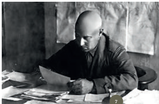
БАХМЕТЕВСКИЙ АРХИВ КОЛУМБИЙСКОГО УНИВЕРСИТЕТА